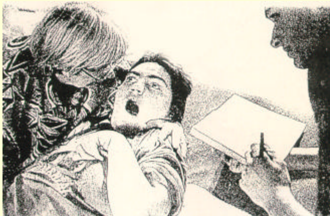
SHT 1984: nach 3,5 Jahren aus dem apallischen Syndrom erwacht!