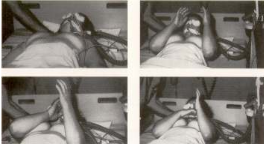
Turmel et al 1991